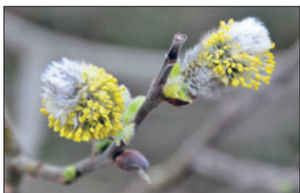
Die Salweide – eine wichtige Pollenquelle für Bienen im Frühjahr und Nahrungspflanze für unzählige Schmetterlingsarten