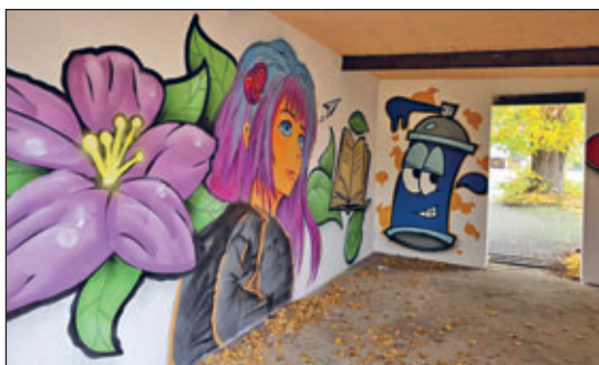
Lebendiges Pulsen e. V.

Vielen Dank an alle Beteiligten für die Unterstützung bei der Umsetzung des Projektes. Es ist durch gemeinschaftliches Engagement ein wahrer Mehrwert für das Ortsbild entstanden.